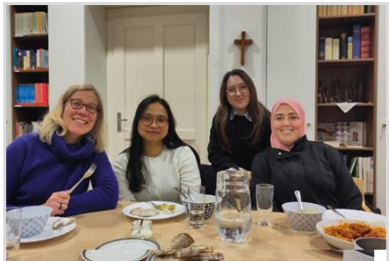
Christinnen und Muslimas beim gemeinsamen Fastenbrechen.

Und Gemeinschaft zu pflegen ist in beiden Religionen sehr wichtig. Schön, dass wir das zusammen an diesem Abend zusammen erleben konnten!