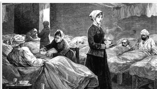
Florence Nightingale im Krimkrieg, 1853-1856, zeitgenössische Darstellung.