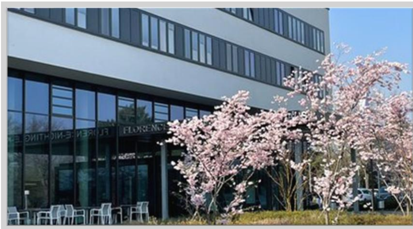
Das Florence Nightingale Krankenhaus