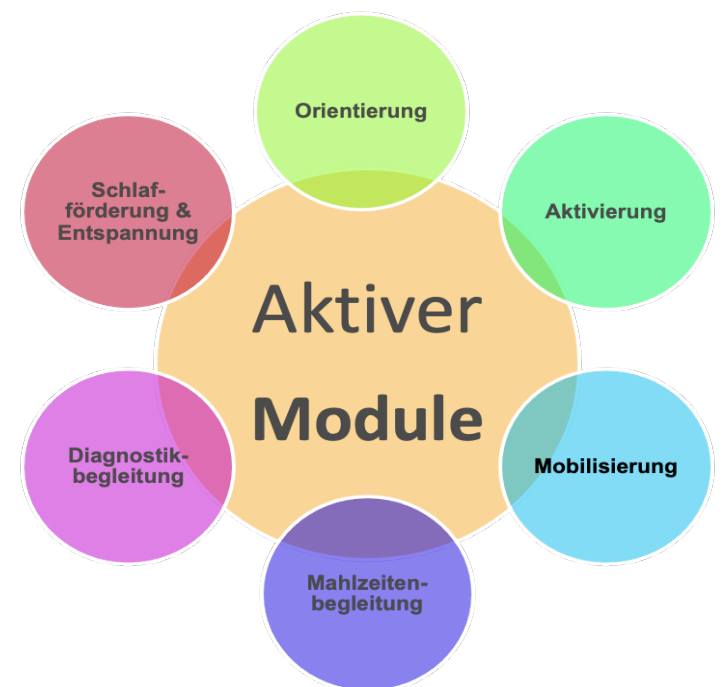
Abb. 2: Module zur nichtpharmakologischen Delirprävention und -behandlung