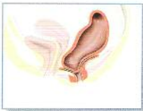
Prolapsed rectum with rectocele and intussusception