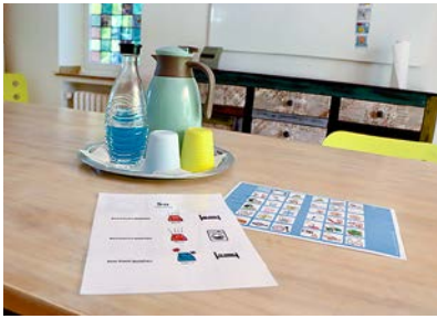
In der neuen Wohngemeinschaft haben vier junge Männer ein neues Zuhause gefunden.