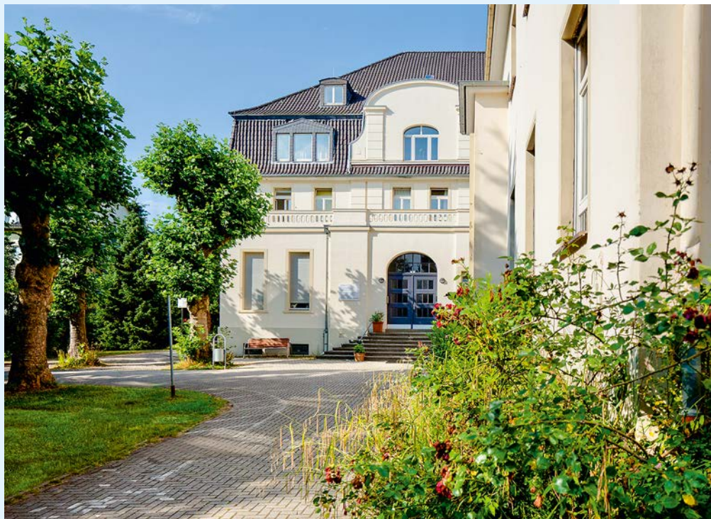
Die Pflegeschule hat ihren Sitz in Haus Elisabeth in Kaiserswerth.