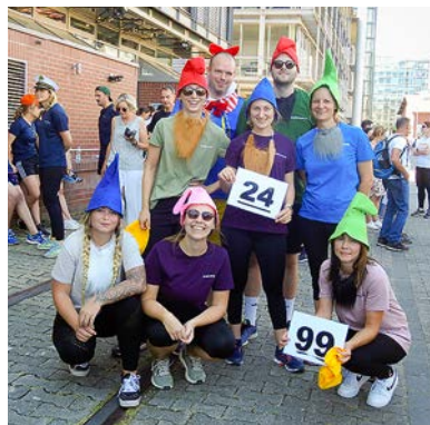
Die Teams des Florence-Nightingale-Krankenhauses zeigten vollen Einsatz gegen den Krebs.