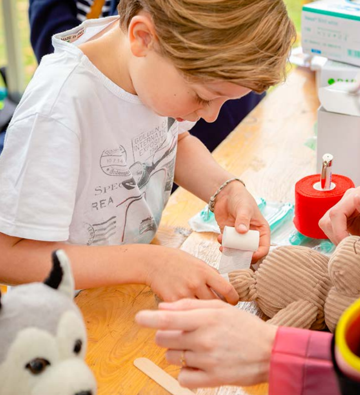
Text: Annette Debusmann