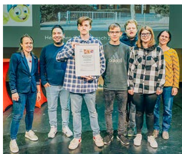
Feierliche Übergabe des Kreativsonderpreises.

Der Start der Bauarbeiten ist für März 2023 geplant und die Bauzeit wird auf ein Jahr geschätzt, sodass die Inbetriebnahme im Frühjahr 2024 erfolgen soll.