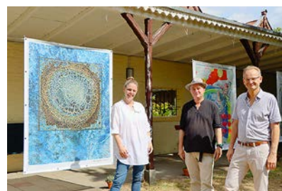
Die Ausstellung zeigte Werke der Dortmunder Gruppe im idyllischen Klinikgarten.

(kb) Anfang September feierte die Klinik für Psychiatrie und Psychotherapie am Florence-Nightingale-Krankenhaus ihr 170-jähriges Bestehen mit einem fröhlichen Spätsommerfest. Eingeladen waren Mitarbeitende, Patient:innen und Interessierte. Das Highlight: die Big-Banner-Ausstellung von Künstler:innen der „Dortmunder Gruppe“, die ihre Werke in den lauschigen Laubengängen der Klinik ausstellten. Ein paar Tage später