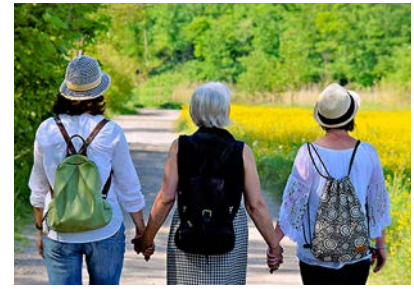
Die Kaiserswerther Schwesternschaft beteiligte sich an der Pilgerinitiative „Take Care“.