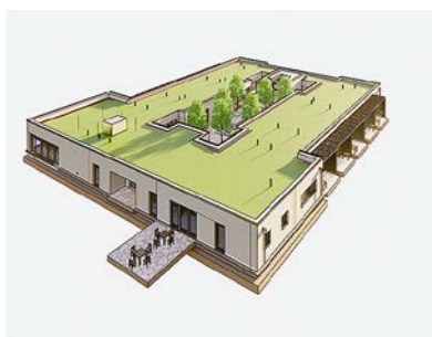
Das Hospiz bietet unheilbar erkrankten Menschen in ihrer letzten Lebensphase Raum.

(ad) Die für Kaiserswerth zuständige Bezirksvertretung 5 hat im August 2022 den Bauantrag der Kaiserswerther Diakonie für die Errichtung eines stationären Hospizes genehmigt. Der eingeschossige Bau wird auf dem Campus der Kaiserswerther Diakonie errichtet und bietet bis zu zehn Menschen in ihrer letzten Lebensphase Pflege und Fürsorge. Das insgesamt 980 m 2 große lichtdurchflutete Gebäude auf der Wiese hinter dem Gertrud-Schacky-Haus wird zudem einen großen Versammlungsraum, eine geräumige Wohnküche, einen großzügigen Innenhof, einen Raum der Stille sowie Büroräume erhalten. Ergänzend kommen Lager- und Technikräume hinzu, sodass das Hospiz eine autark funktionierende Einrichtung werden wird.